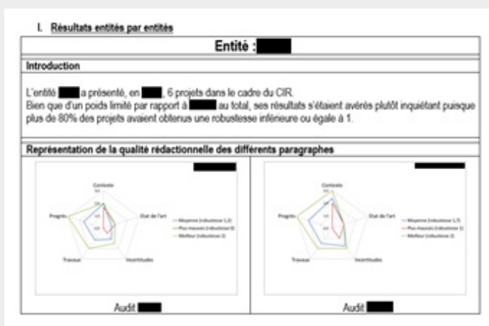
Figure 1 : visuels de rapports d'audit – 1

De la sécurisation des Crédits d'Impôts déterminés en interne ou par un cabinet tiers à la demande de clients, PME, ETI, grands comptes.